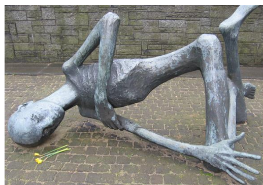
Skulptur: Françoise Salmon, „Der sterbende Häftling“, Mahnmal in der Gedenkstätte Neuengamme

Ort: Beginn am „Lagerbahnhof“ | Eingang zum Appellplatz (Bushaltestelle „Ausstellung“) | Jean-Dolidier-Weg 75 | 21039 Hamburg