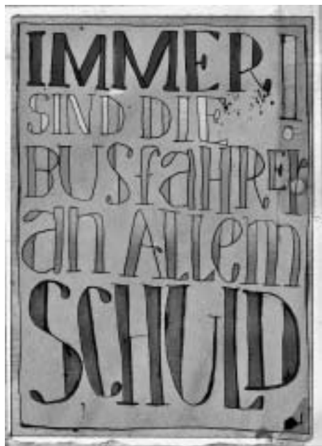
Postkarte mit mut-proben-geschichte

Ein nordelbisches Projekt zur Dekade zur Überwindung von Gewalt 2001-2010 des Ökumenischen Rates der Kirchen