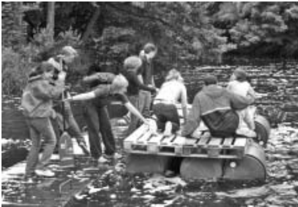
Floßfahrt auf der Oberalster

und haben einen hohen erlebnispädagogischen Wert. Mit der Gruppenarbeit und der offenen Arbeit deckt der CVJM die "klassischen" Formen der Jugendarbeit ab. Daneben hat sich seit vielen Jahren mit TEN SING als musisch-missionarischer