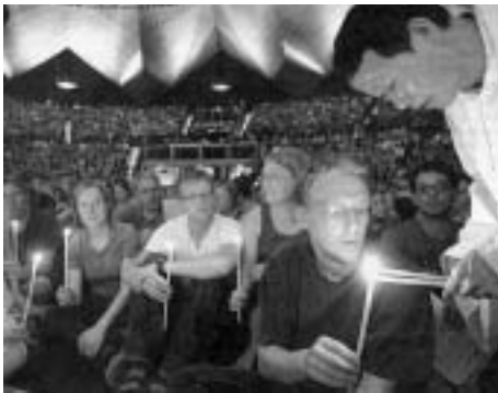
Gebet in Taizé

Zehntausende von Jugendlichen waren dieses Jahr unterwegs zum kleinen französischen Ort Taizé. Von allen Kontinenten strömen sie nach Taizé, um miteinander im Gebet und Gespräch zu sein. Seit mehr als 50 Jahren steht dieses Dorf für Frieden und Völkerverständigung und für eine ganz eigene Frömmigkeit. Daneben ist Taizé Sitz einer Bruderschaft, die ein sehr vielfältiges Netzwerk in die ganze Welt unterhält. Hier gehören Gebet, praktisches und diakonisches Handeln zusammen.