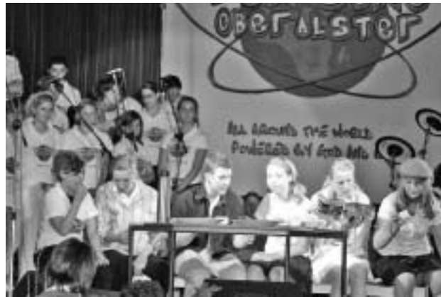
Das begeistert: Jugendliche beim TEN SING

burger Bürger seine übergemeindliche christliche Jugend- und Junge-Erwachsenen-Arbeit in einem eigenen Haus weiterentwickeln.